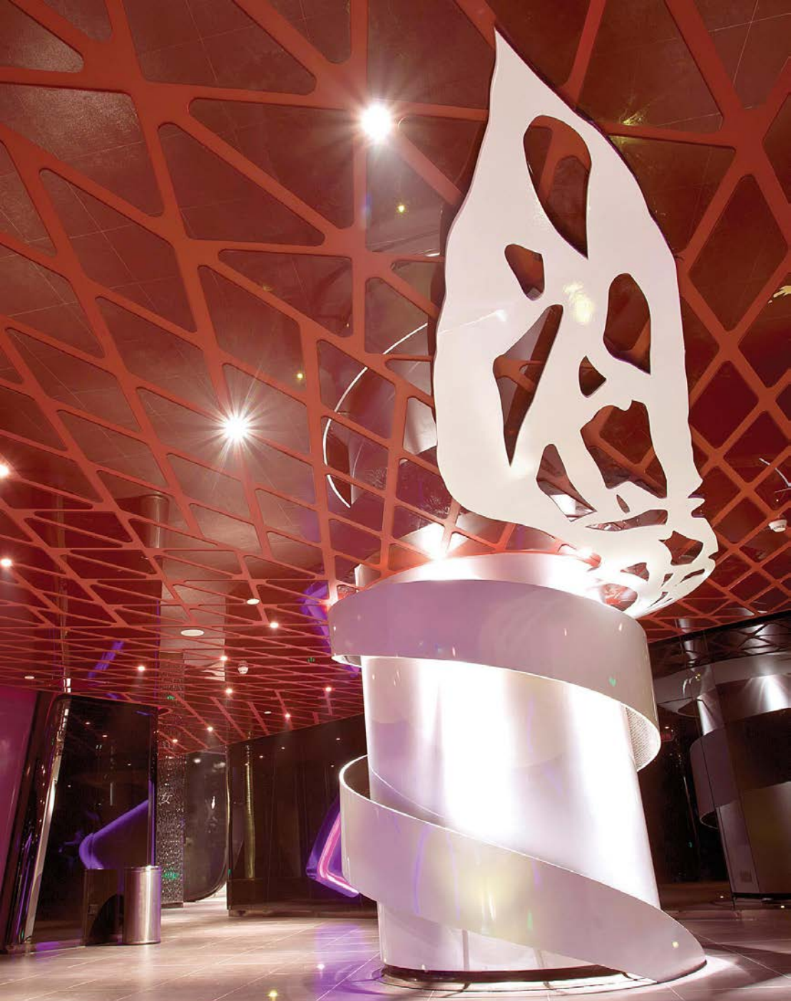
不规则网格状顶部与射灯结合如漫天星空一般，广场中间的装置艺术与顶部网格相呼应，仿佛进入科幻空间。