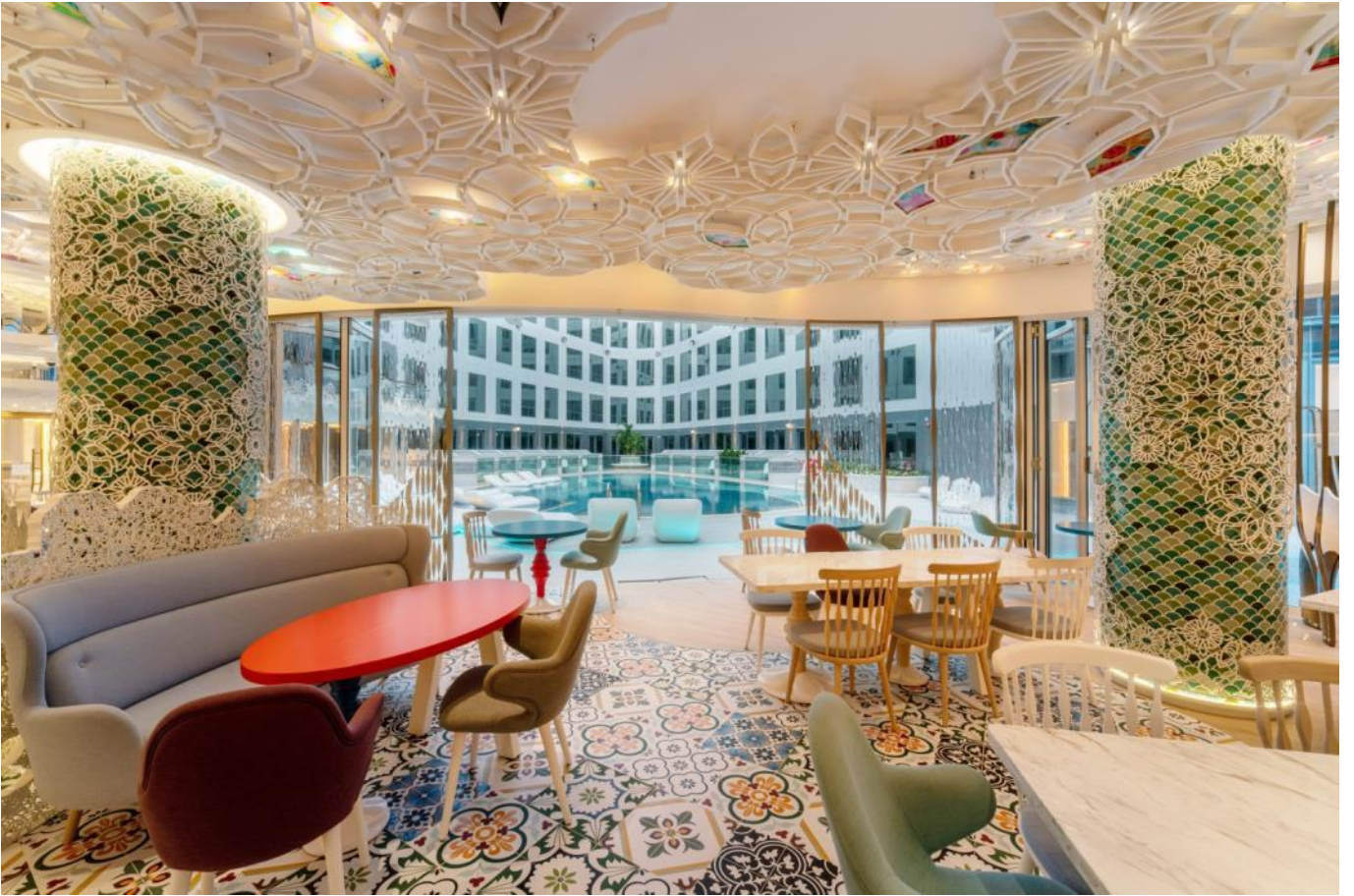
俯瞰游泳池 (Overlooking The Pool)