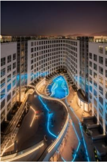
内院 (Inner Courtyard)