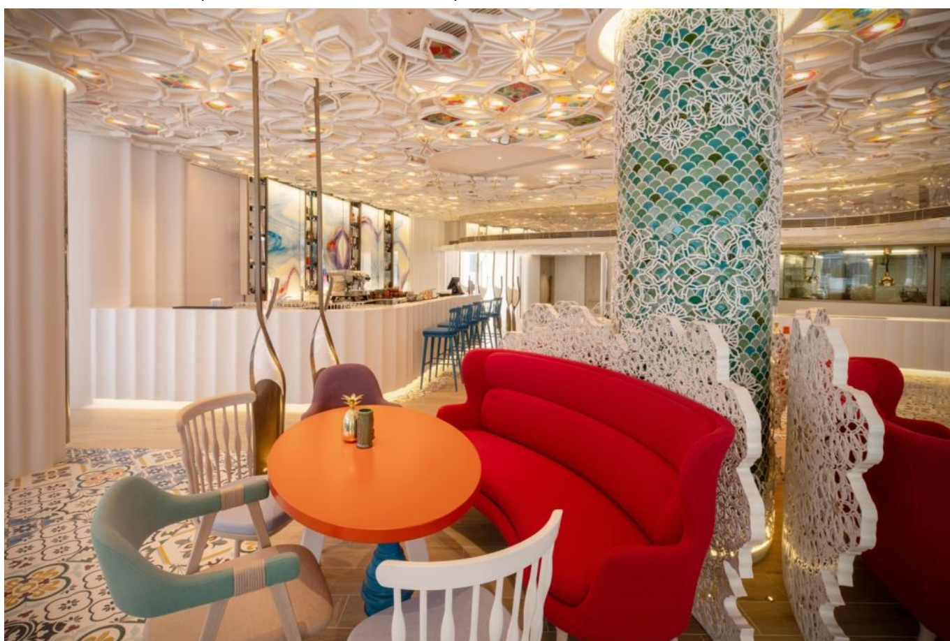
酒吧区 (Bar Area)