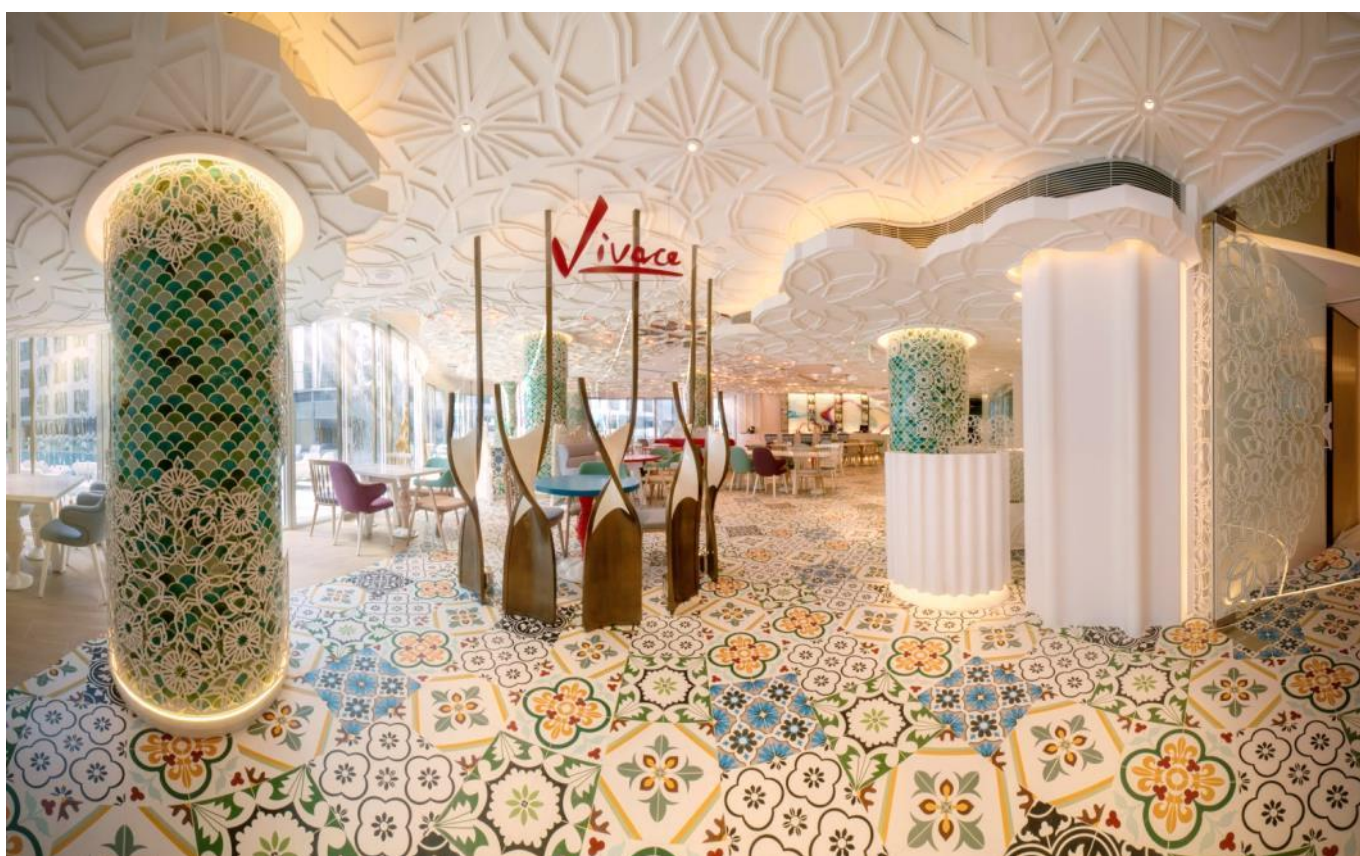
主入口 (Main Entrance)