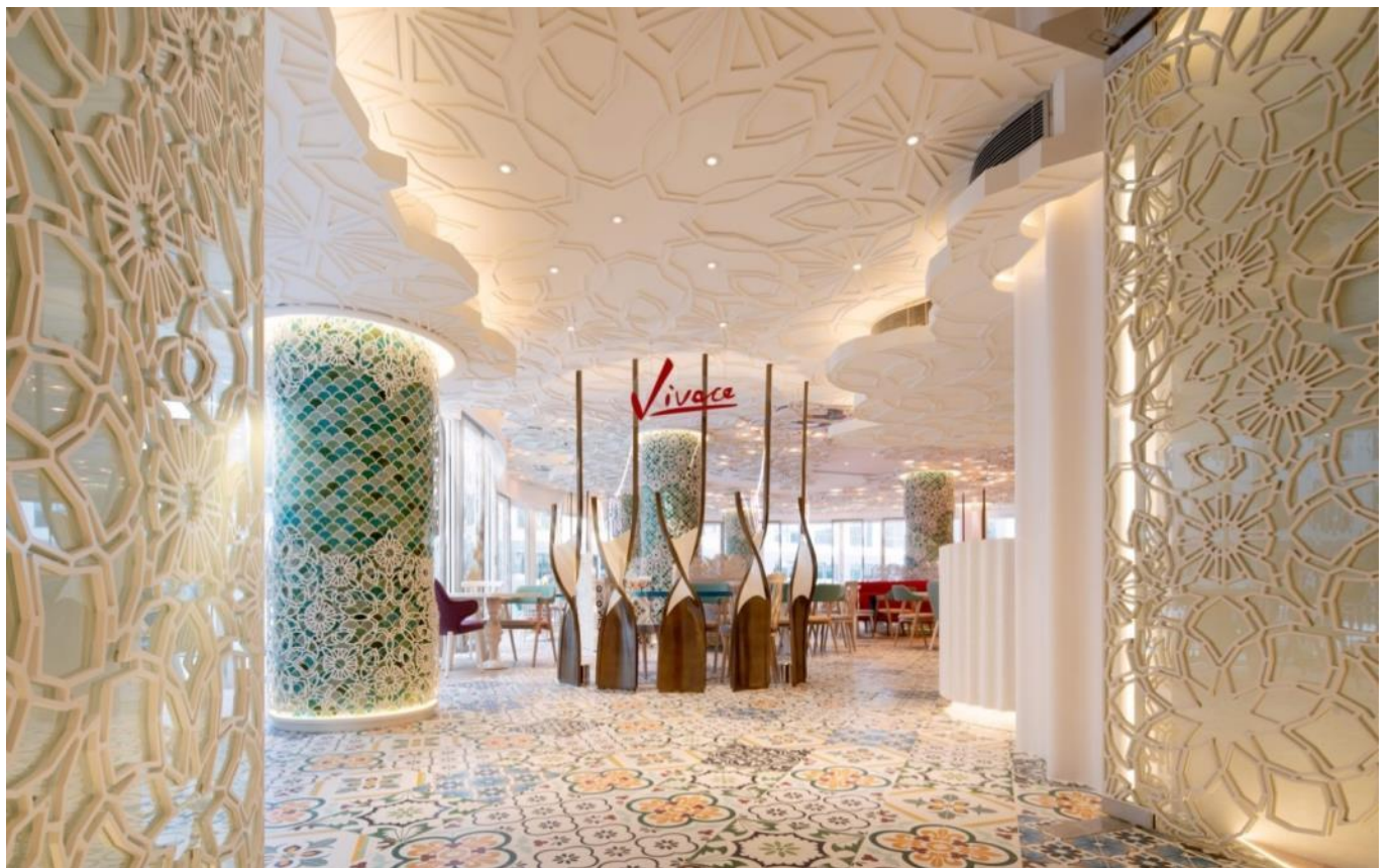
VIVACE · 冰与火