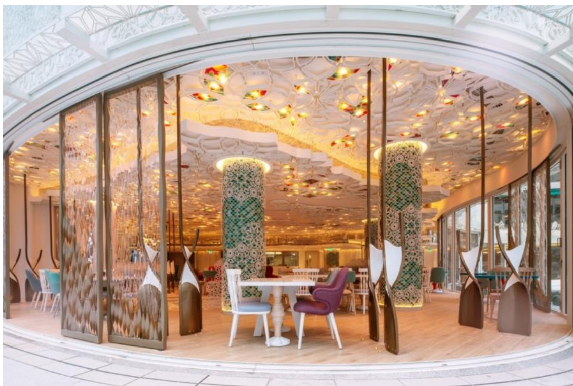
从泳池甲板往里看 (Looking in from Pool Deck)