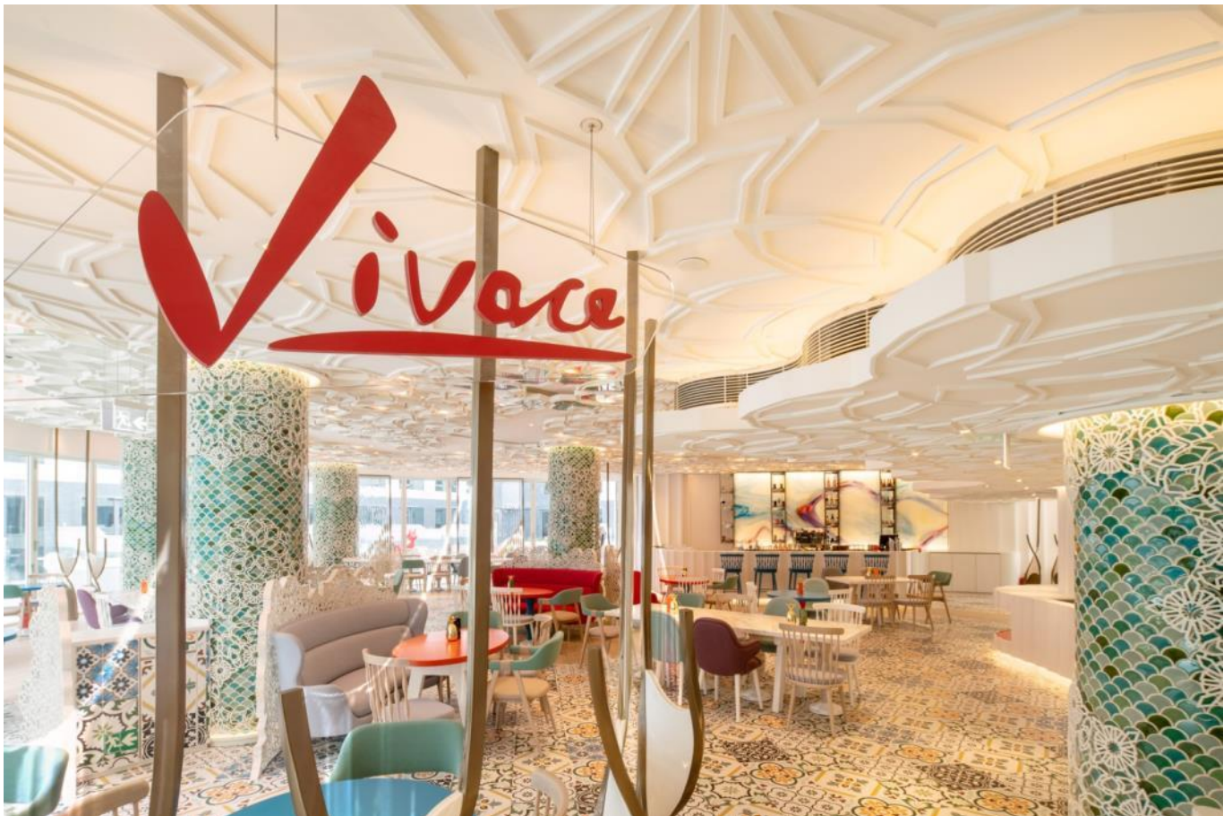
VIVACE · 冰与火