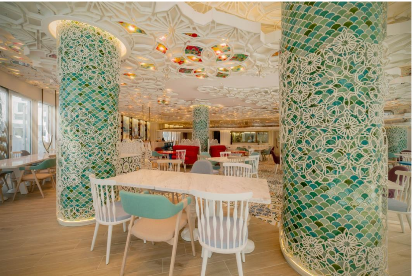
柱子细节 (Column Details)