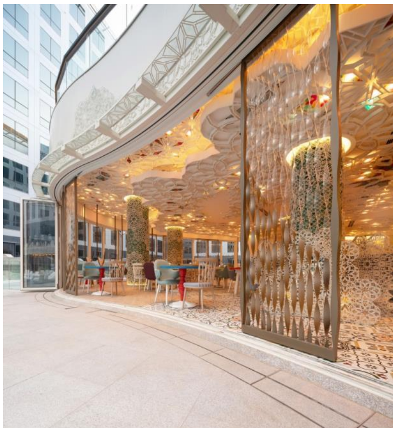
从泳池甲板往里看 (Looking in from Pool Deck)