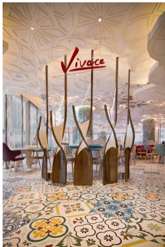
螺旋形玻璃屏风 (Spiral Screens)