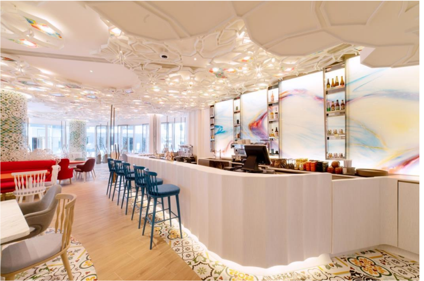
酒吧 (The Bar)