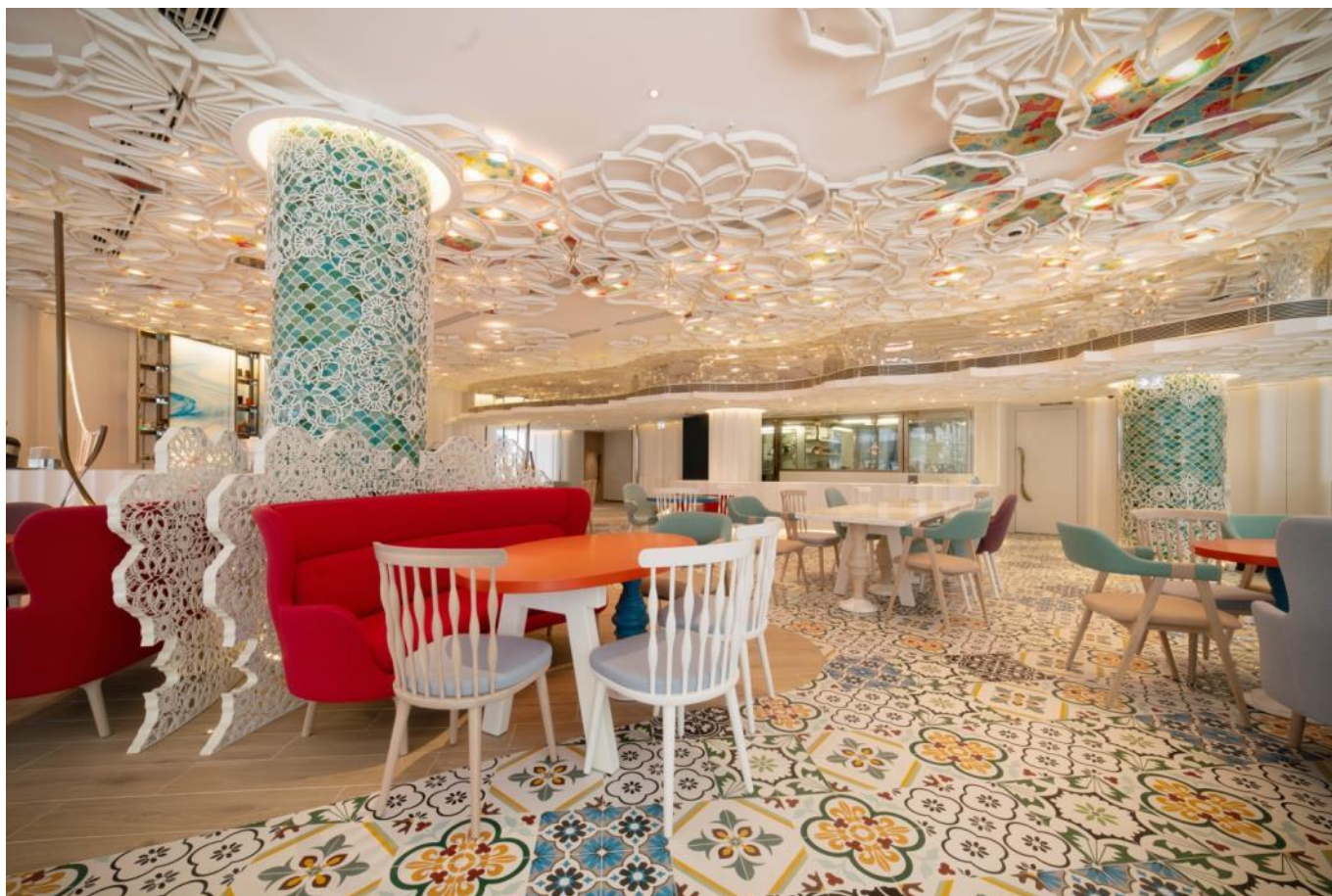
主要区域及在后面的厨房 (Main Area with Kitchen at the Back)