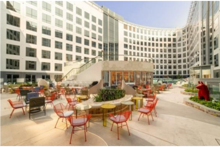
泳池甲板及上层婚礼露台 Pool Deck and Upper Patio for Weddings